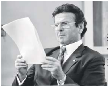
O ministro Luiz Fux, do STJ, indicado para o STF

Brasília - O ministro Luiz Fux, do Superior Tribunal de Justiça (STJ), foi indicado pela presidente Dilma Rousseff para ocupar a 11ª vaga de ministro do Supremo Tribunal Federal (STF). A indicação foi publicada na primeira página do Diário Oficial da União de ontem, 2.