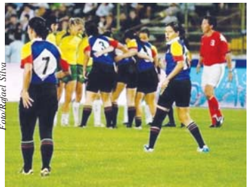
Colômbia foi vice em 2010

Argentina, Venezuela, Paraguai, Uruguai, Chile e Peru também tentarão o título em Bento Gonçalves (RS)