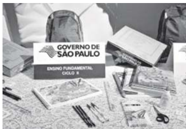
Neste ano serão encaminhados três kits diferentes às escolas, de acordo com o ciclo em que o aluno está matriculado.

os estudantes da rede. "Priorizar a Educação envolve muitas ações e, entre elas, está a distribuição de material escolar de qualidade para os alunos da rede", disse o secretário Herman Voorwald.